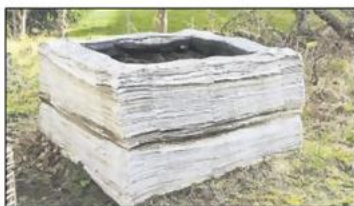
Hochbett aus Zeitungen, die langsam versteinern.

Dieses Bild ist urheberrechtlich geschützt. Quelle für Artikeltextdarstellung: Artikeltext oder Artikel- und Ganzseitendarstellung.