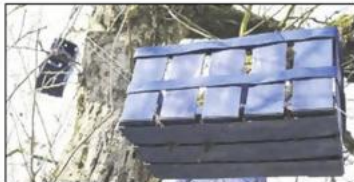
Blaue Obstkörbe am Faulenzer-Baum.